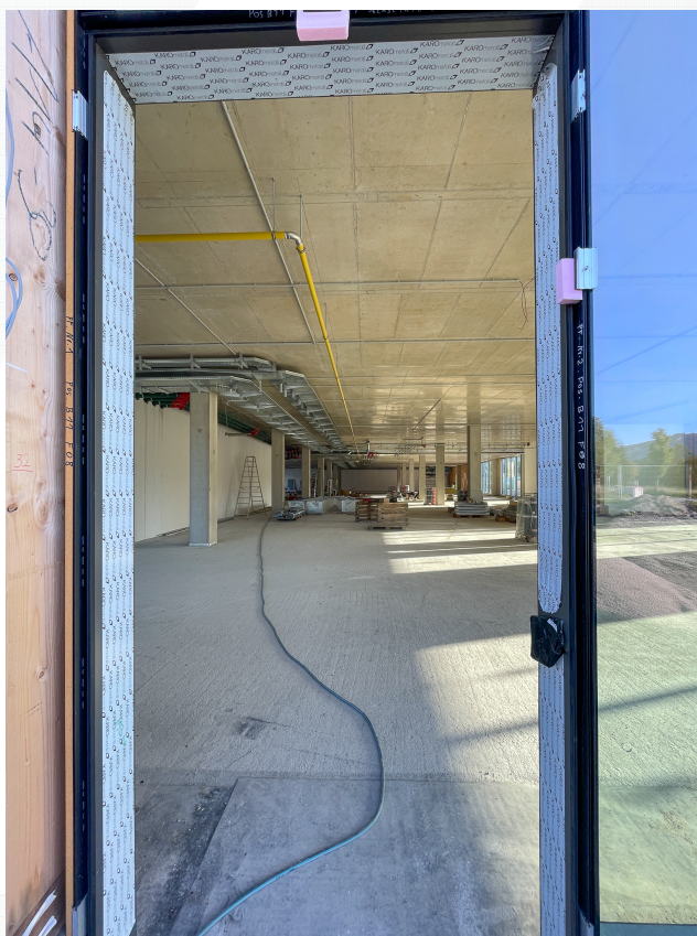
hochwertige Portale und Türen

Alle Angaben nach bestem Wissen. Irrtum und Zwischenvermietung vorbehalten. Dieses Exposé ist eine Vorinformation, als Rechtsgrundlage gilt allein der abgeschlossene Mietvertrag.