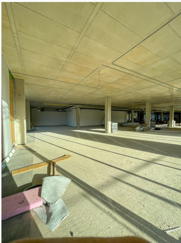
Innenausbau noch möglich