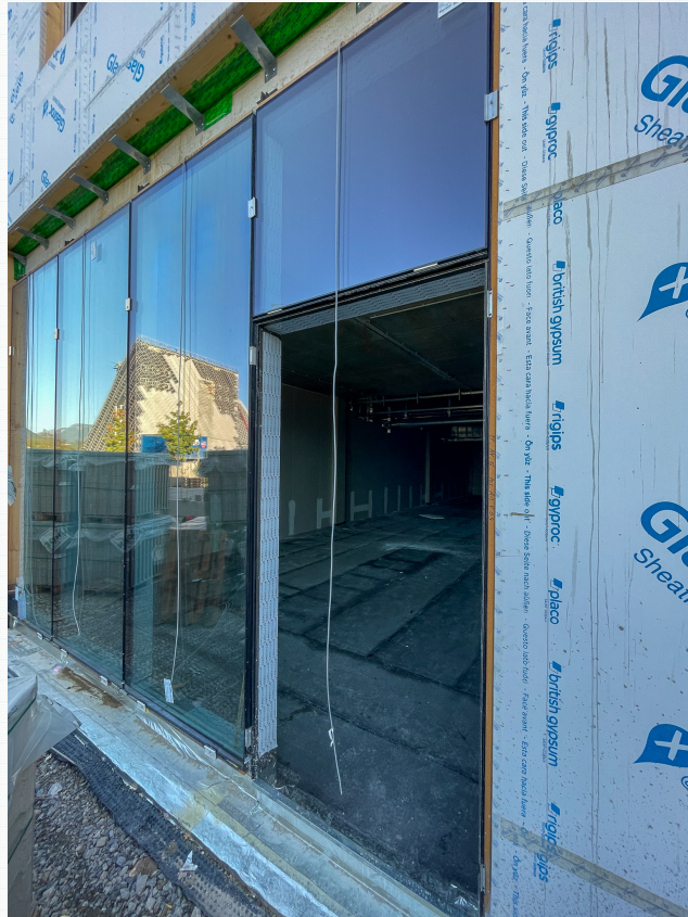
Glasscheiben mit UV-Schutz